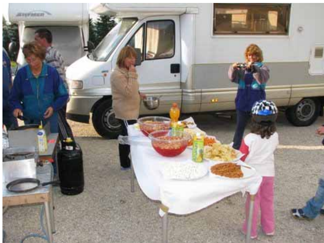
Aperitivo per tutti...